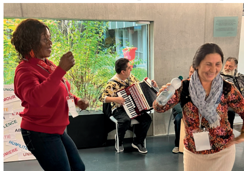
La rencontre et la fête, à l'Université de la diaconie.

Pour répondre à l'appel du pape de vivre une « Église pauvre pour les pauvres », l'Église catholique romande (services Solidarités des diocèses) a donné la parole aux per-