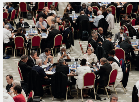
La deuxième session du Synode se tiendra dans la salle Paul VI du Vatican, comme en octobre 2023.

Un nouvel Instrument de travail sera élaboré en vue de la 2ème session du Synode.